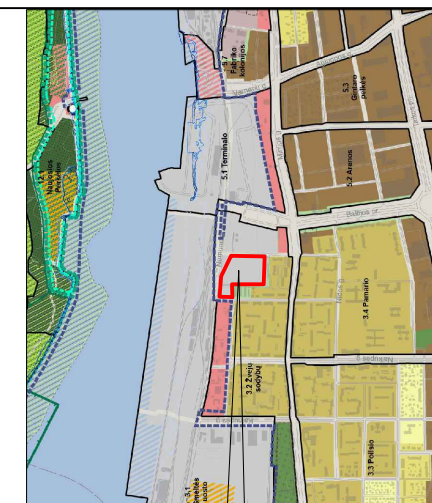
Planuojamos teritorijos situacija (Pagrindas: Klaipėdos miesto bendrojo plano sprendinių pagrindinis brėžinys)