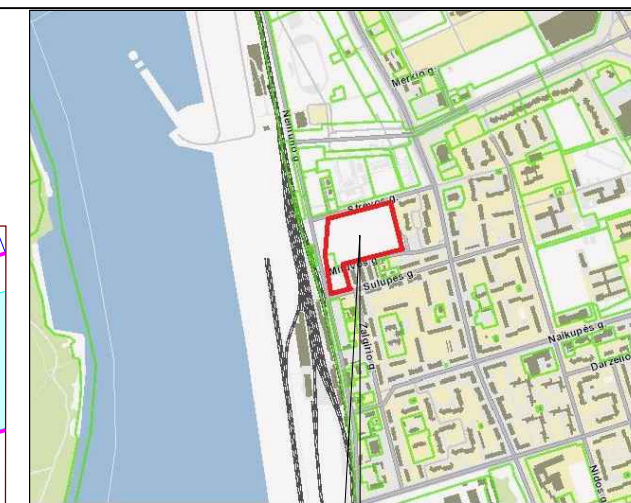
Planuojamos teritorijos situacija (Pagrindas: www.regia.lt)